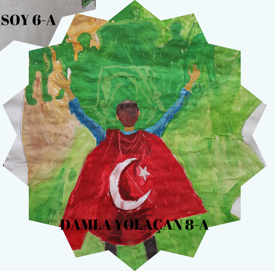
DAMLA YOLAÇAN 8-A