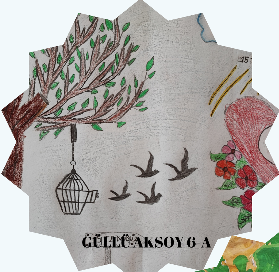
GÜLLÜ AKSOY 6-A