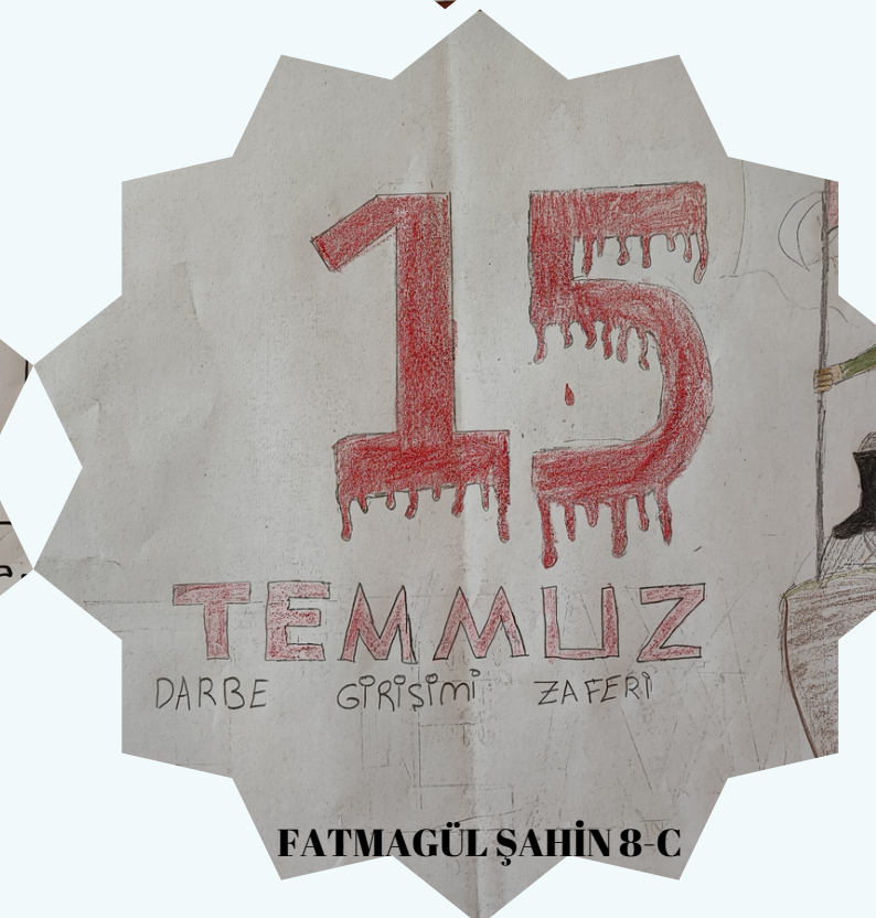
FATMAGÜL ŞAHİN 8-C