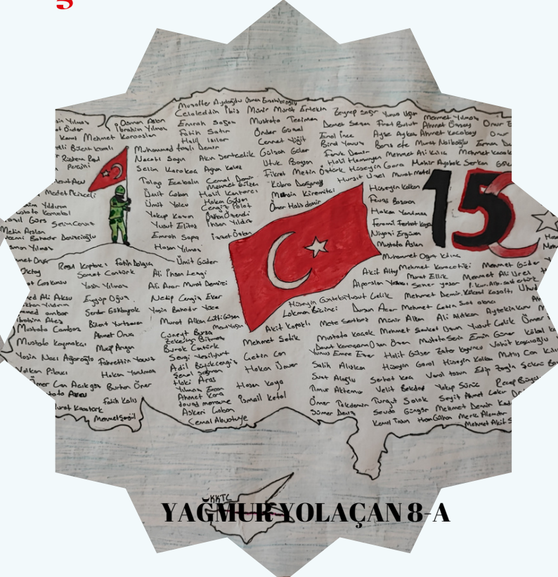
YAĞMUR YOLAÇAN 8-A