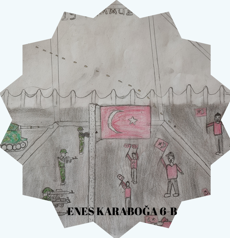
ENES KARABOĞA 6-B